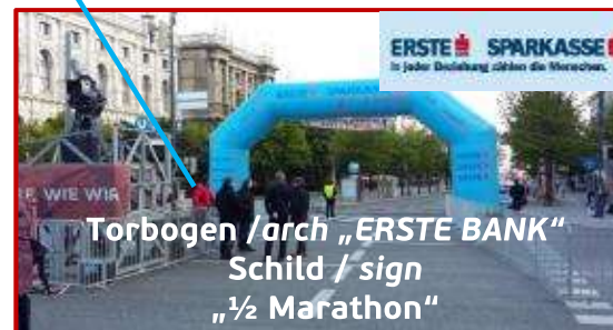
Torbogen / arch „ERSTE BANK“ Schild / sign „1/2 Marathon“