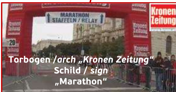
Torbogen / arch „Kronen Zeitung“ Schild / sign „Marathon“

Marathon and Relay Runners Get into the left lane in good time and continue running straight ahead!